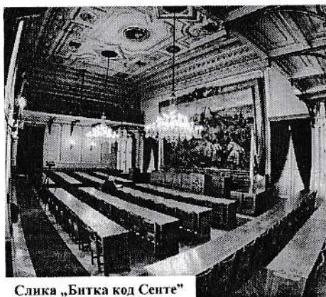
Слика „Битка код Сенте“

Оваком резултату посећености туриста нашем граду свакако доприноси тенденција пораста страних туриста у Југоисточној Европи и свету, константност промоције туристичких организација