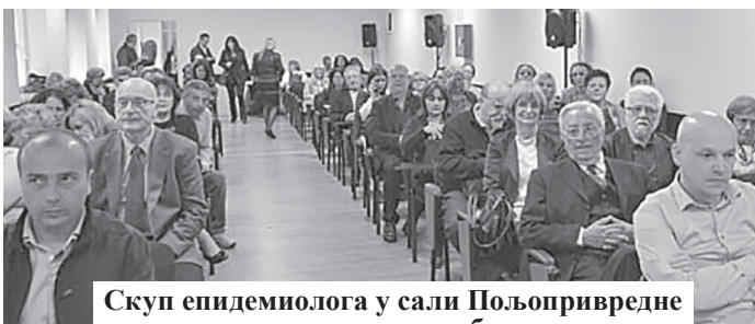
Скуп епидемиолога у сали Пољопривредне стручне службе