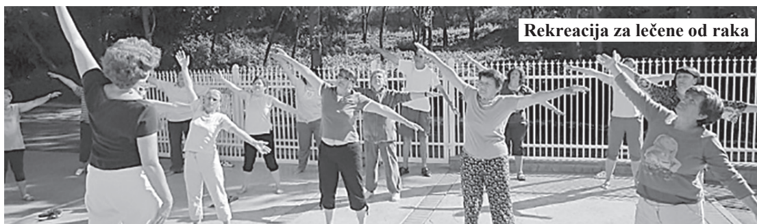
Rekreacija za lečene od raka