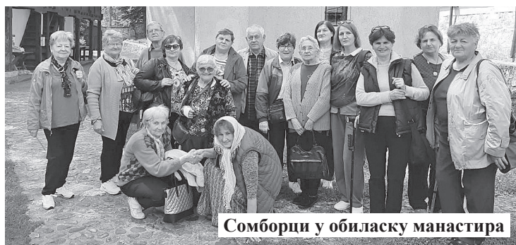
Сомборци у обилазку манастира

Partneri u ostvarivanju ovoga cilja bili su i Opšta bolnica „Dr Radivoj Simonović“, Zavod za javno zdravlje Sombor i apoteka „Vipera“.